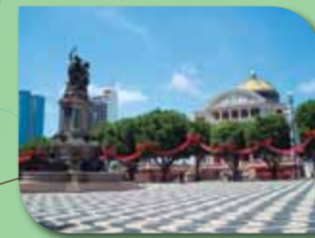
Largo São Sebastião