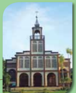
Matriz Santo Ângelo