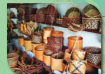
Loja Arte Waimiri-Atroari

Conhecida atração da região, a observação do boto vermelho, o boto cor-de-rosa atrai diversos visitantes a Novo Airão. Considerado um dos símbolos da fauna amazônica, esses mamíferos aquáticos, que se alimentam de peixes, podem ser admirados no Flutuante dos Botos, localizado próximo ao ancoradouro do ICMBio e à Câmara de Vereadores do município. Devem ser respeitadas as regras de conduta na observação desses graciosos animais, como não alimentá-los ou molestá-los.