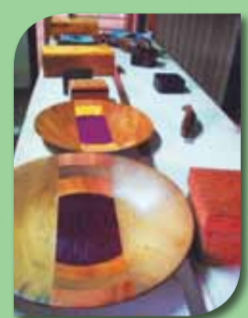
Fundação Almerinda Malaquias