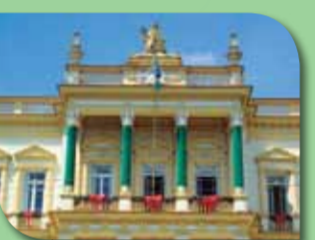
Palácio da Justiça

Para os visitantes que desejam conhecer de perto uma parte do legado histórico que Manaus preserva, boas opções não vão faltar. Inaugurado em 1906, com matéria-prima proveniente da Inglaterra, o edifício da Alfândega foi um dos primeiros prédios a ser construído no Brasil com blocos em pedra. Principal porta de entrada da produção pesqueira e rural na cidade, o Mercado Municipal "Adolfo Lisboa", aberto em 1882, é uma réplica do mercado "Les Halles" de Paris.