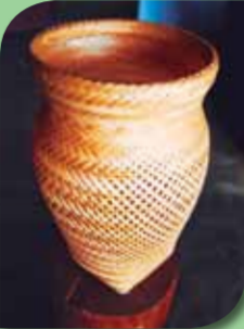
Associação de Artesanato de Novo Airão - AANA