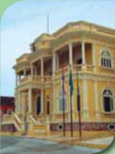
Palácio Rio Negro

Maior bioma do país em extensão, com mais de 4.000.000 Km 2 , a Amazônia Brasileira compreende uma área equivalente a 49,29% do território nacional, estando presente nos Estados do Amazonas, Acre, Amapá, Pará, Roraima, Rondônia, Tocantins, oeste do Maranhão e norte do Mato Grosso. Região de maior biodiversidade do planeta, marcada pela exuberante floresta e riqueza hídrica, abriga, pelo menos, 20% de toda a água doce da superfície terrestre. Sua diversidade biológica, até então conhecida, reúne mais de 40 mil espécies de plantas, 300 espécies de mamíferos, 1,3 mil espécies de aves e de 3 mil a 9 mil espécies de peixes.