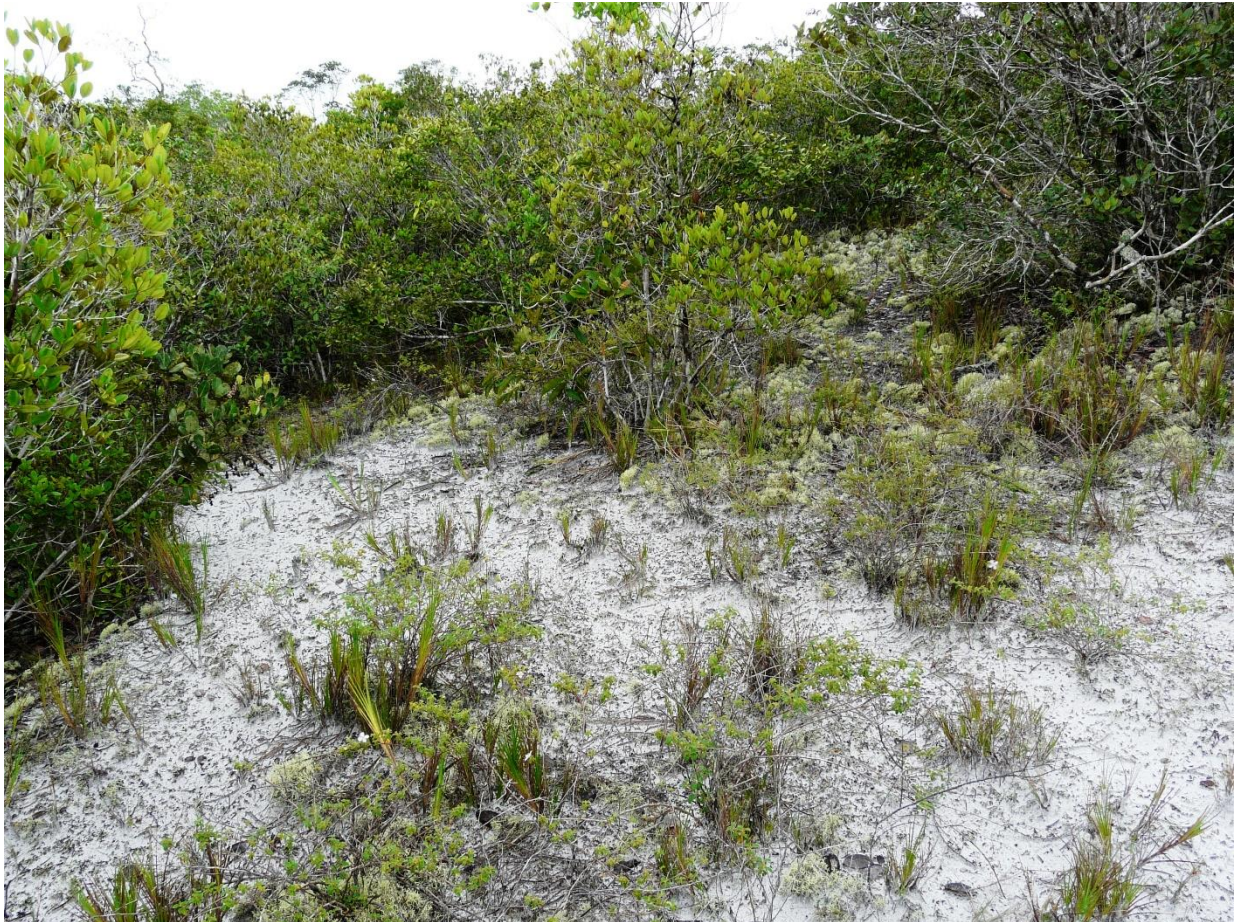
Paleoduna acessada pelo igarapé Preto.

atual, constituindo um local de extrema importância para a pesquisa e para a conservação da dinâmica do bioma Amazônia. Coordenadas 01°09'25.11"N/61°54'18.03"O