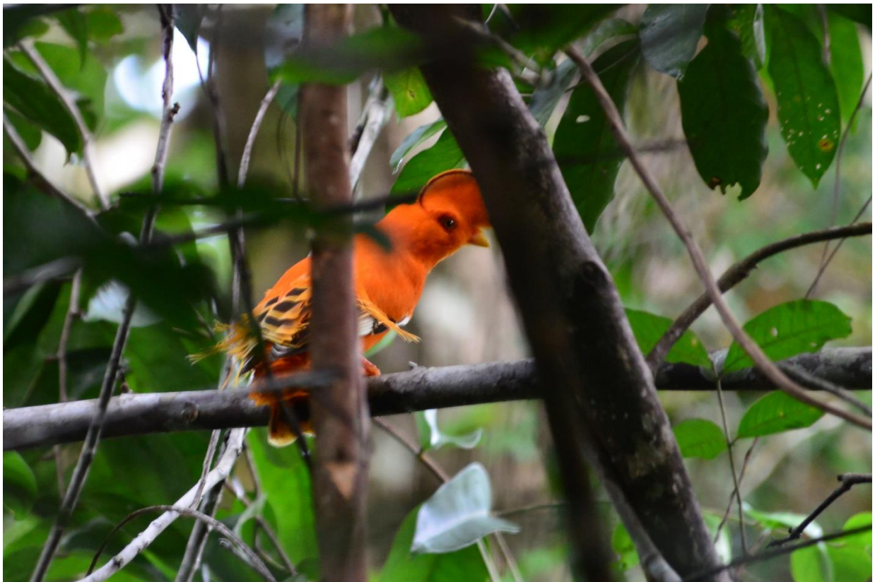
Galo da Serra ( Rupicola rupicola ).

❖ Rios e igarapés – Os rios e igarapés presentes no parque estão inseridos em uma paisagem de rara beleza e totalmente primitiva, formando praias de areia branca e águas transparentes. As atividades que podem ser desenvolvidas são: passeio fluvial, caiaque, observação de fauna e flora, flutuação nos rios de águas claras e acampamento.