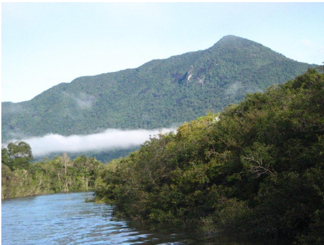
Rio Água Boa do Univini e a Serra do Cumaru ao fundo.