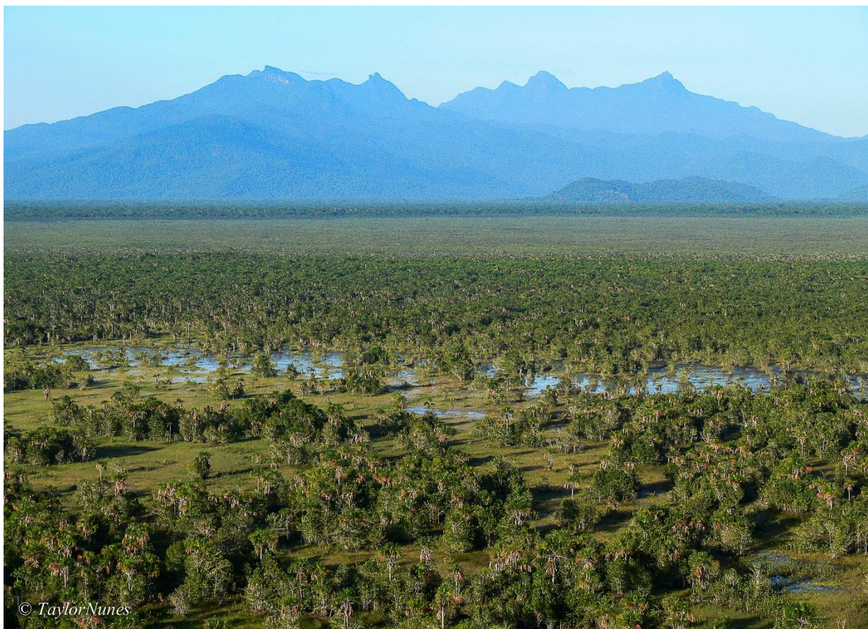
Serra da Mocidade e os campos alagados.