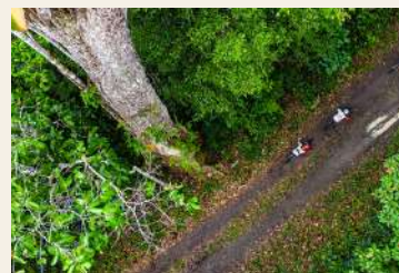
Imagem: Brasil Ride @brasilride